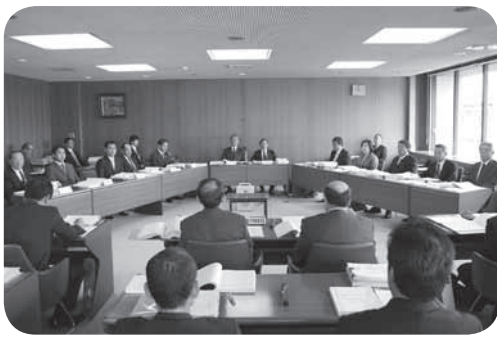
決算審査特別委員会審査の様子