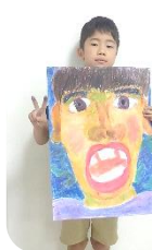
「自分」口を開けた所に気をつけて描きました。(2年生)