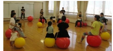
写真は昨年度の様子です