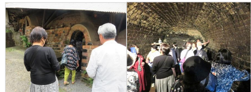
過去に使われていた窯を見学。内部はひんやりしていました