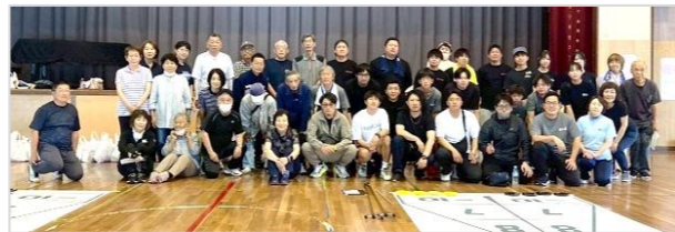
5/31(日)に西条校区連合自治会主催のレクリエーション大会「シャフルボード」が開催されました。本町3丁目チームが優勝しました。おめでとうございます。白熱したゲーム展開を繰り広げ、いい汗をかいて笑顔で楽しめましたね。