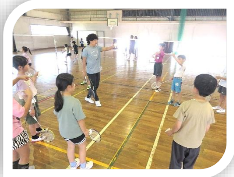
6/13(土)「バドミントン教室」 ラケットに慣れることから始めよう