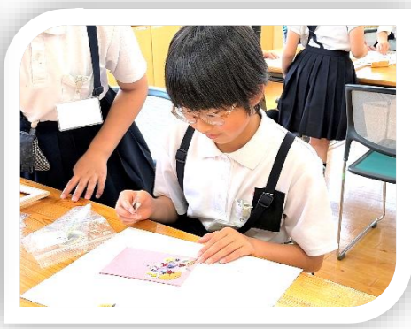
6/3(水)「押し花」 写真額に押し花を散りばめました