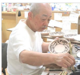
職人技を間近で見学