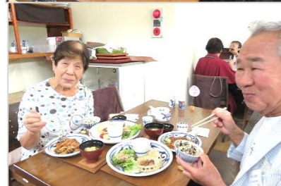
昼食は砥部焼の器を使ったお料理。いろいろな柄の器がありましたね。お気に入りがありましたか？