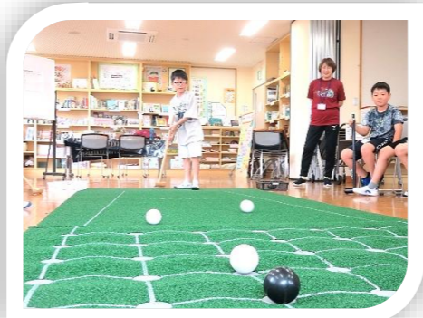
6/6(土)「ちびっ子リンピック」 いろいろな軽スポーツに挑戦！