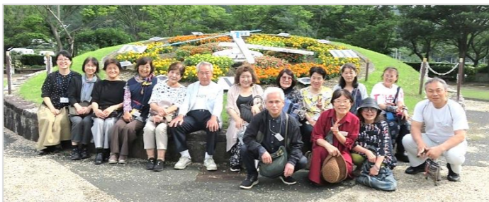
県農林水産研究所農業研究部花き研究指導室の花時計前で。お天気にも恵まれ、みなさん大変喜ばれていました。