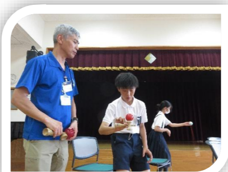
6/17(水)「けん玉教室」 めざせ検定1級！練習がんばるぞ！