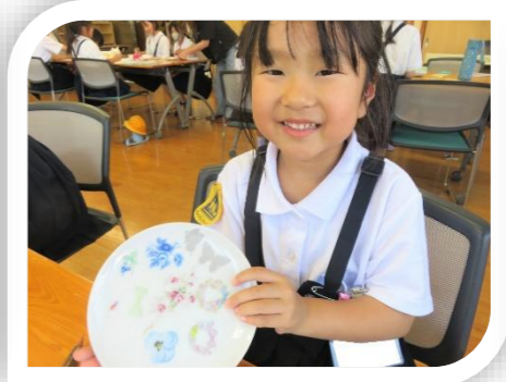
6/10(水)「ポーセラーツ教室」 私だけのオリジナル絵皿ができたよ！