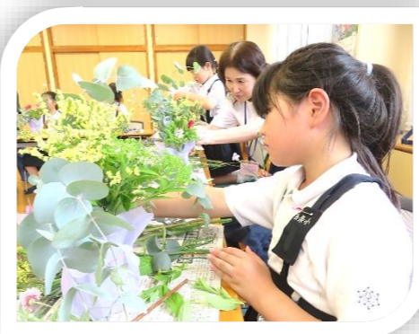
5/27(水)「花あそび」 季節の花々を生けて楽しんでいます。