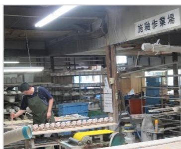
釉薬は茶色→藍色(焼成後)へ。