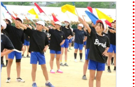
心配していたお天気もみんなの願いが届いて持ち応え、心地よい風の吹く中、運動会が開催されました。開会式では全員でスローガンを唱和、赤白それぞれの応援による「全校応援歌」は、元気のよい歌声が天まで届きました。5、6年生の演技はストーリー性もあり、感慨深いものがありましたね。どの競技も友だちと協力し合って、最後まで粘り強く頑張りました