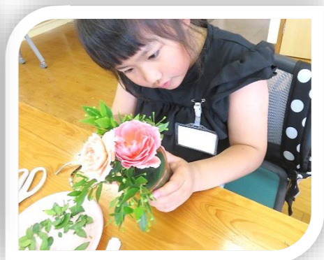
5/30(土)「花工房」 ハンドバッグアレンジメントを作りました。