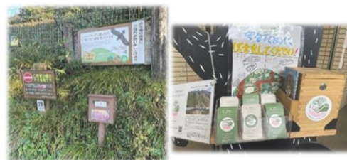
伊吹山入山協力金の様子