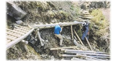
登山道整備やシカ食害対策等を実施