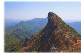
色鮮やかな紅葉に染まる石鎚山