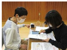
写真は昨年の様子です