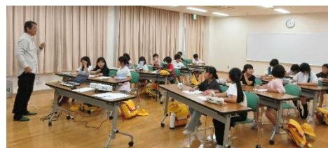
写真は昨年の活動の様子です