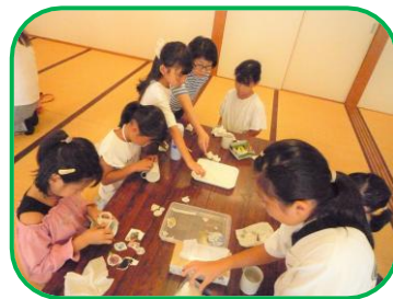
〈ポーセラーツ教室〉