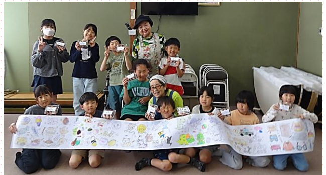
『さくらもち』も『ぬりえ』も完成しました!