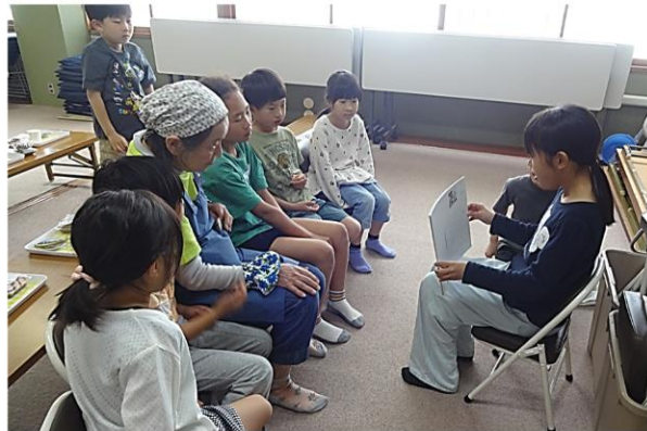
おともだちが紙芝居を読んでくれたよ。