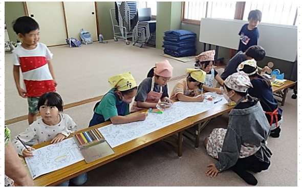
ぬりえの時間もあります。みんな集中して、塗ってくれました😊