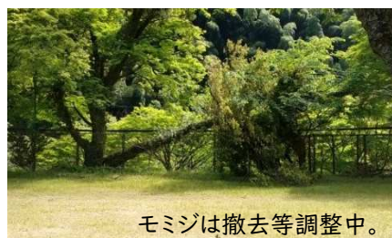
モミジは撤去等調整中。

旧鞍瀬小学校の樹木倒れる 大型連休中の大風で県道側のモミジの一部と駐車場石垣側のサクラ1株が倒れました。幸いケガ人もなく、現在のところ通行等に支障はありません。モミジは撤去等に向けて調整中です。