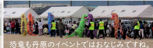
恐竜も丹原のイベントではおなじみですね。