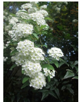
コデマリ 4/27 公民館の近所