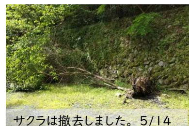
サクラは撤去しました。5/14