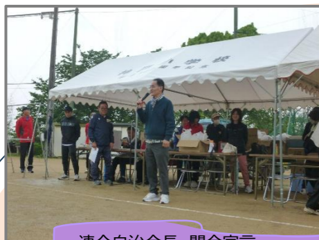
連合自治会長 開会宣言 行事を通してふれあい、活気を!!