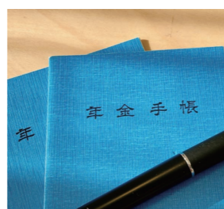
年金の種類を確認しよう

手続きをお考えの方は年金事務所へお早めにお問い合わせください。 ● 新居浜年金事務所 Tel.0897-135-1300 ● 市庁舎新館1階 市民課 Tel.0897-52-1383 ● 西部支所 総務市民課