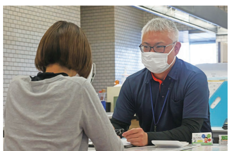
一人で悩まず、まずはお気軽にご相談を

「障がいの総合相談窓口」をご利用ください 障がいのある方やそのご家族を地域全体で支えるための相談窓口「西条市障がい者基幹相談支援センター」が新しくできました。 障がいに関する生活・仕事・医療・福祉・人間関係・将来の不安など、なんでもかまいません。お気軽にご相談ください。 ▼相談窓口 ○市庁舎本館1階 Tel.0897-531-0870 ○西部総合福祉センター1階 Tel.0898-641-2600 ▼受付日時 月～金曜日 8時30分～17時15分 (祝日・年末年始は休み)