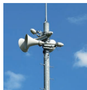
いざという時、命を守る放送