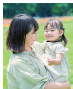
対象の方は、お早めに

申請内容に変化が生じた場合(学生として届出した後、通学先の変更、退学、住所変更など)状況が変わった場合)も必ず届け出してください。