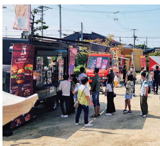
毎月第4日曜日に開催中!