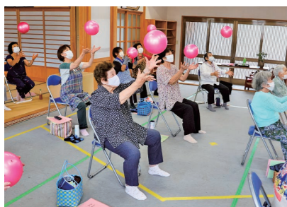
地域でもっと自分らしく、生き生きと

令和9年3月末で「生きがいデイサービス」は終了します 高齢者の皆さんの交流の場として「生きがいデイサービス」を実施してきましたが、身近な地域での活動(百歳体操や高齢者カフェなど)が充実してきたため、令和9年3月末で事業を終了します。 今後は、皆さんが住み慣れた地域でいきいきと過ごせるよう、多様な活動の場をサポートしていきます。「新しい趣味を見つけたい」「地域の集まりを紹介してほしい」という方は、お気軽にお問い合わせください。 ☎市庁舎本館1階介護保険課 Tel.0897-521-1412 ☎各地域包括支援センター(連絡先は20ページ掲載)