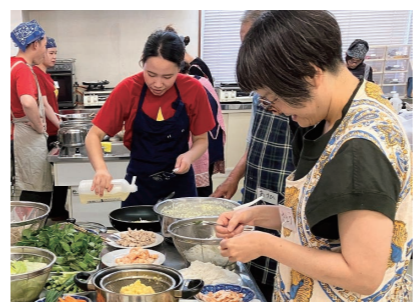
本格ベトナム料理を作って味わおう!

ベトナム料理教室 ▼対象 小学生以上 ※小学生は保護者同伴 ▼日時 6月21日(日) 9時30分～14時30分 ▼場所 神拝公民館 ▼内容 ココナッツジュースでじっくり煮込んだベトナム風の豚肉と卵料理や、ニンニク炒め空心菜などを作ります。 ▼定員 20人(先着順) ▼参加料 ○大人 1500円 (会員1200円) ○子ども 800円 (会員600円) ▼申込期間 6月1日(月)～15日(月) ☎国際交流協会事務局 (SAIJO BASE内) Tel.0897-661-9990