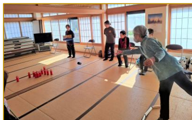
2月は軽スポーツを体験しました