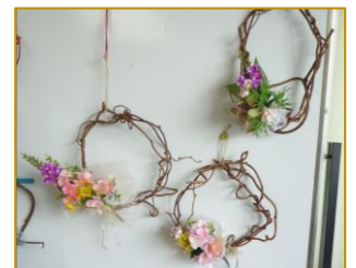
3月はリース作りをしました