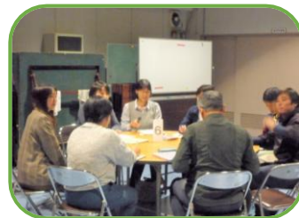
〈イベ長班ミーティング〉

令和8年度に開催したい防災関連イベントについて時間をかけて計画・検討をしました。今後は、イベントの開催に向けての要項・要領を話し合っていきます。