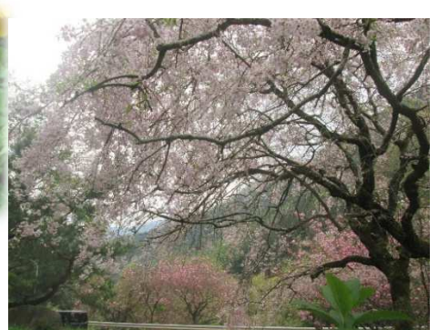
シダレザクラの向こうは ヤエサクラ 落合 4/13

先月号で“はる・るる”と五味太郎の『さる・るる』を 春の楽しいイメージでもじりました。しかし、あらためて『さる・ るる』を読んで(見て)みますと、続編も含めてなんと切ない 落ちでした。