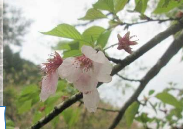
散るサクラ 旧鞍瀬小学校 4/10