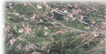
勝手に桜の開花宣言 旧鞍瀬小学校 3/26