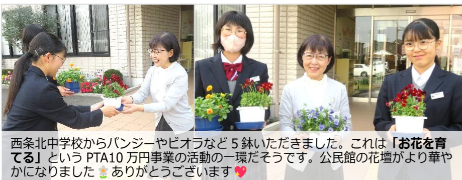
西条北中学校からパンジーやピオラなど5鉢いただきました。これは「お花を育てる」というPTA10万円事業の活動の一環だそうです。公民館の花壇がより華やかになりました。ありがとうございます。