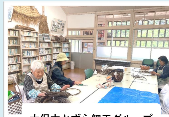
大保木かずら細工グループ