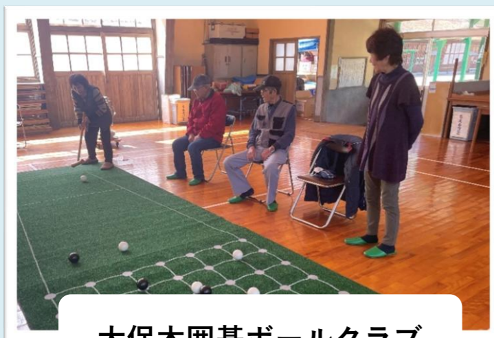
大保木囲碁ボールクラブ

今年度は2サークルが活動中です。会員の皆さんは、和気あいあいとした雰囲気の中でサークル活動をされています。