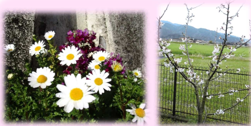
石根公民館に春がやってきました ♡