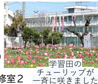
学習田のチューリップが一斉に咲きました