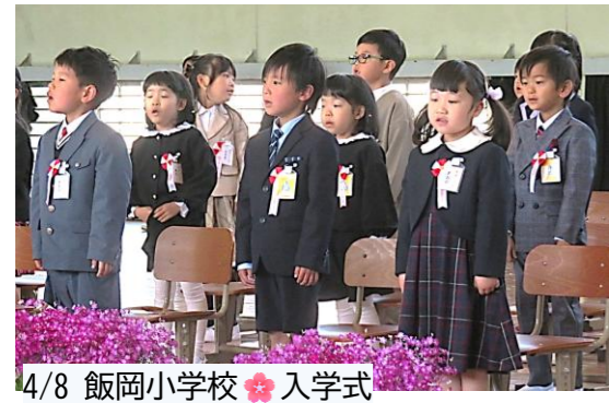
4/8 飯岡小学校 入学式