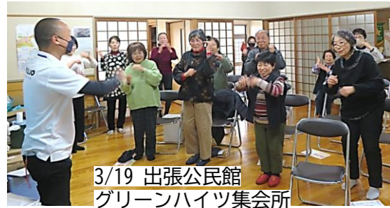
3/19 出張公民館 グリーンハイツ集会所