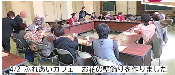
4/2 ふれあいカフェ お花の壁飾りを作りました