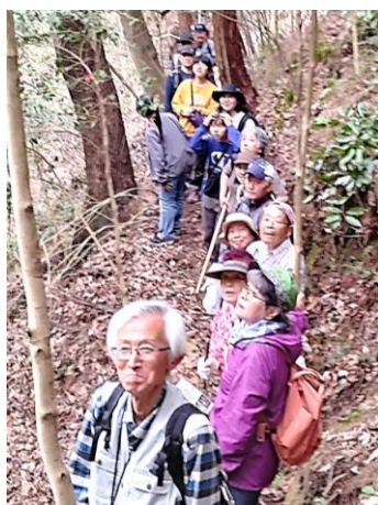
→堂々とした迫力の一の桜