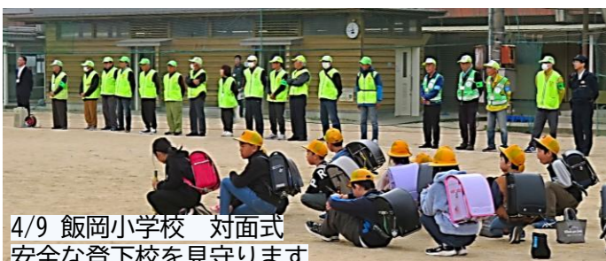
4/9 飯岡小学校 対面式 安全な登下校を見守ります