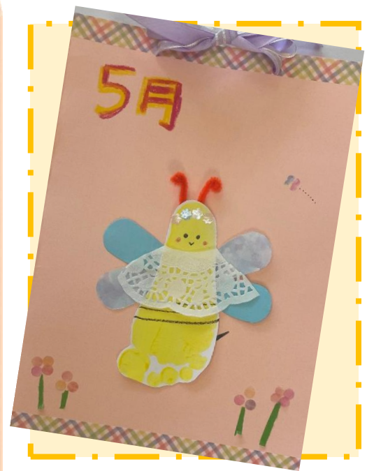
今月の手形アートは「みつばちさん」