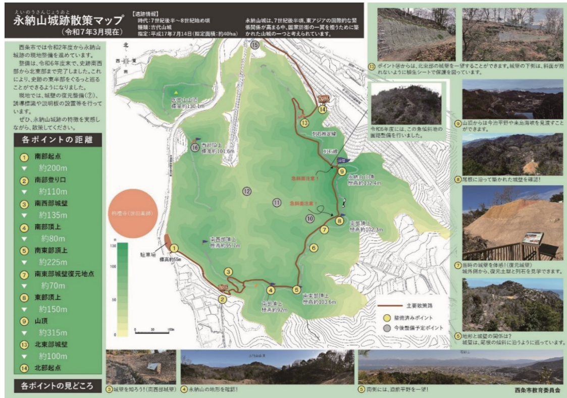
図表11-5-6 永納山城跡散策マップ

また、同年度には、社会教育課が散策マップを作成した。最新の調査結果を踏まえて、随時改訂を加えている（図表11-5-6）。