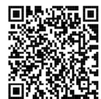
(ため池ハザードマップ: 愛媛県西条市ホームページ)