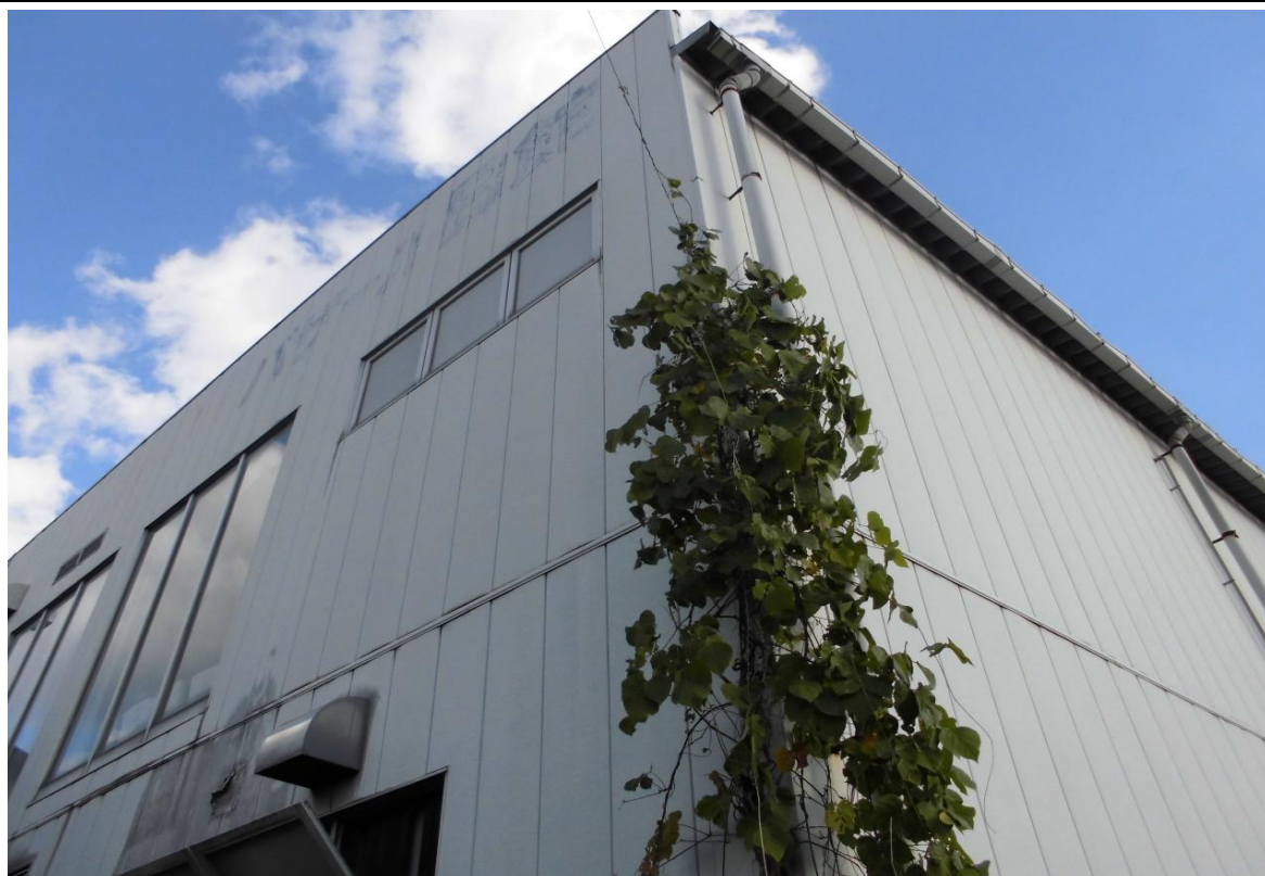
対象不動産の北西側より撮影