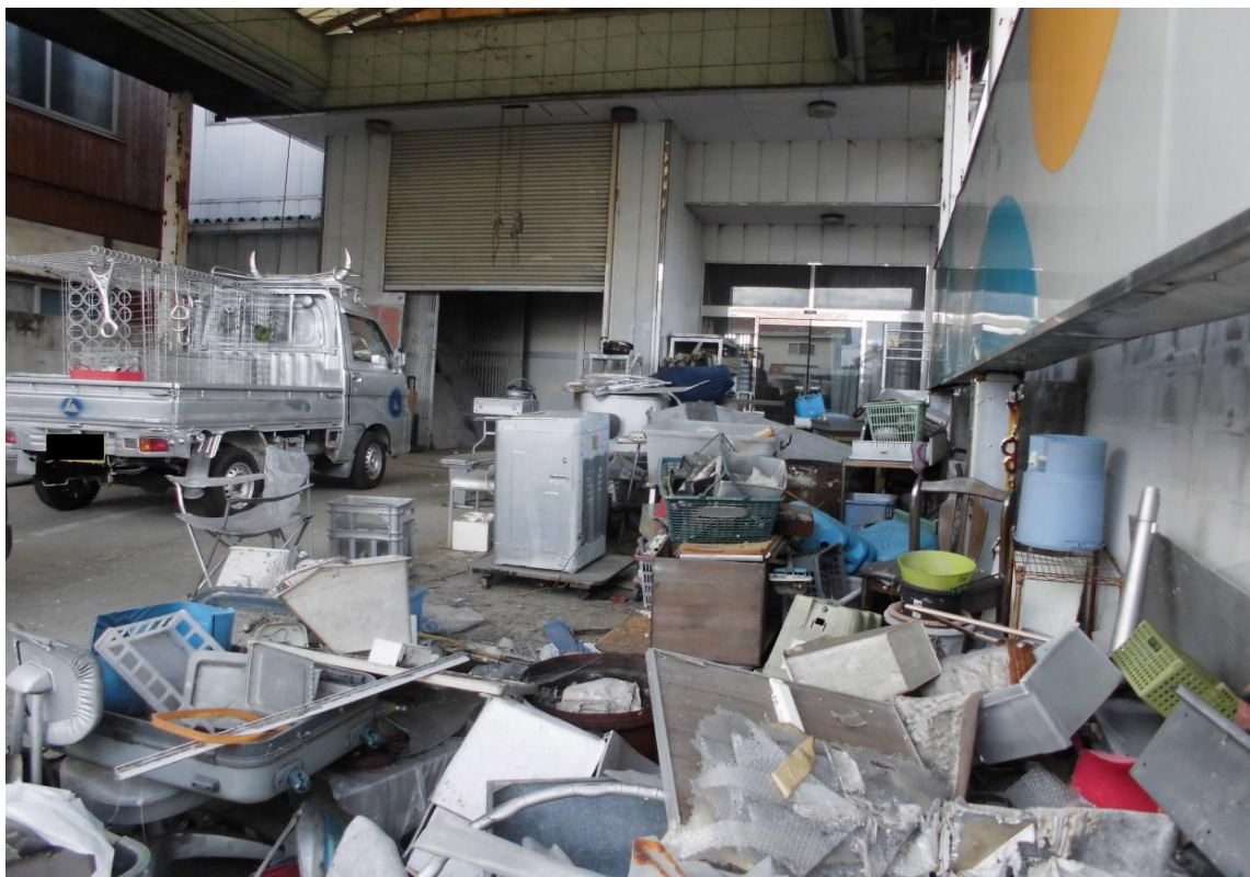
対象不動産の東側より撮影