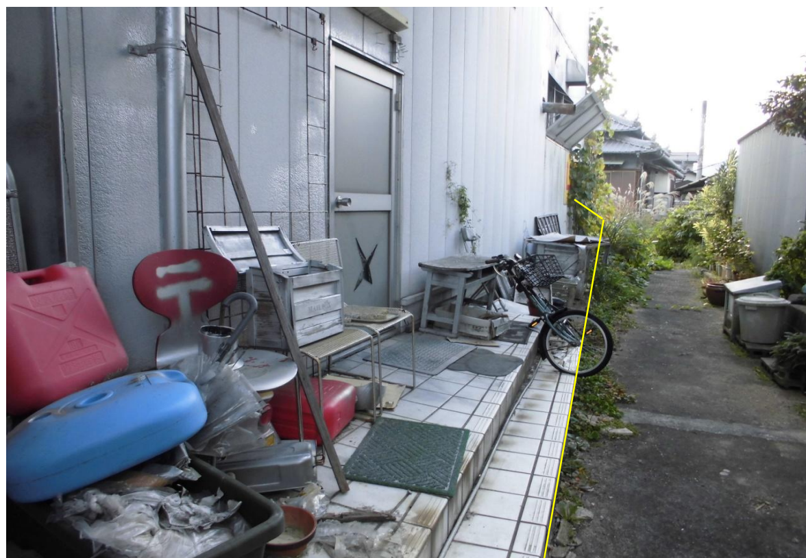
対象不動産の北東側より撮影