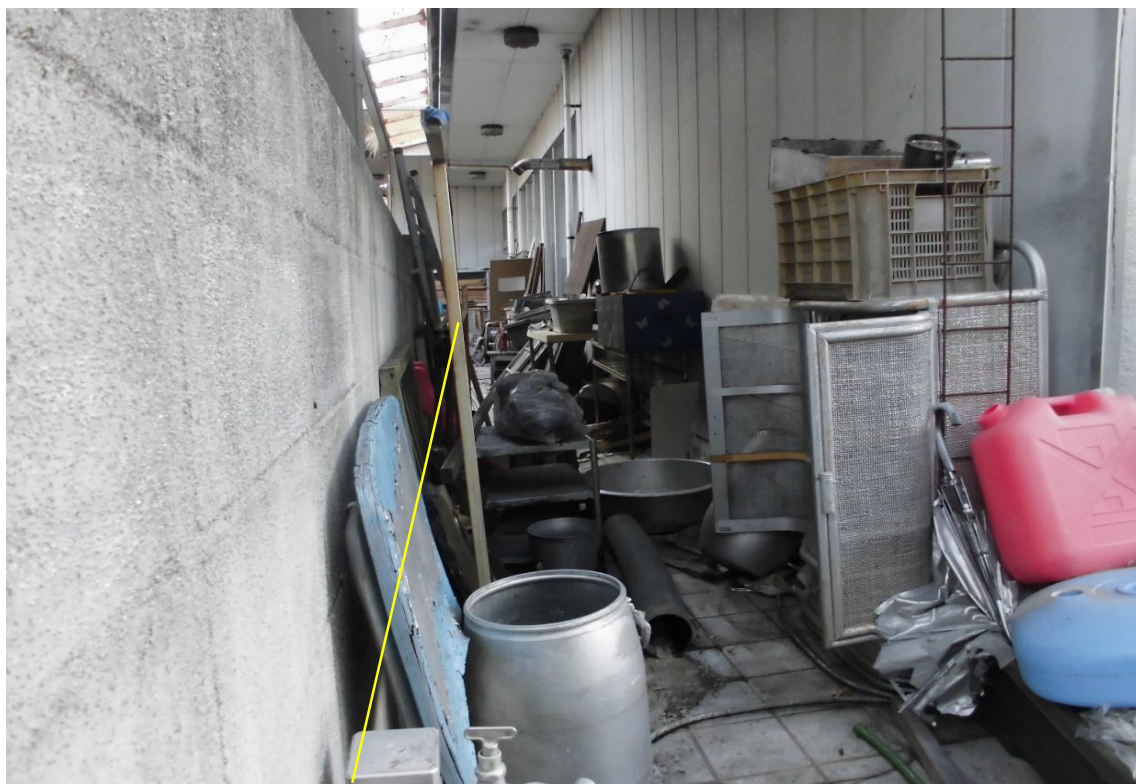
対象不動産の北側より撮影