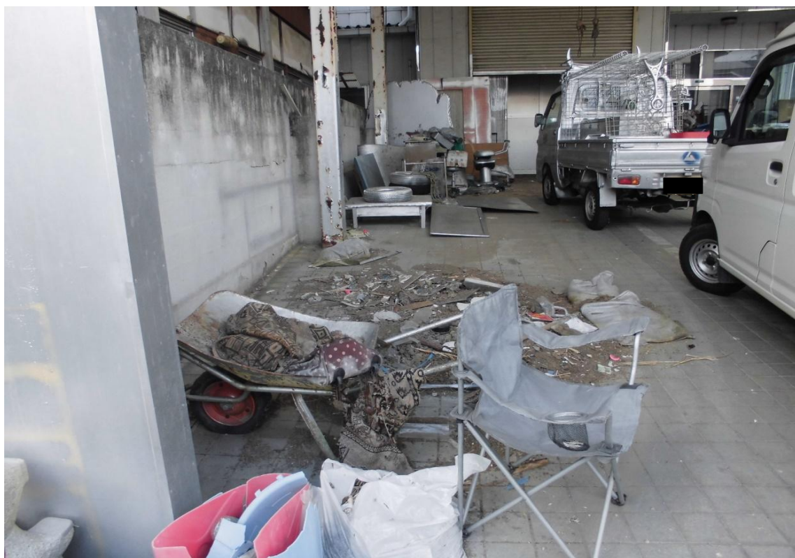
対象不動産の東側より撮影