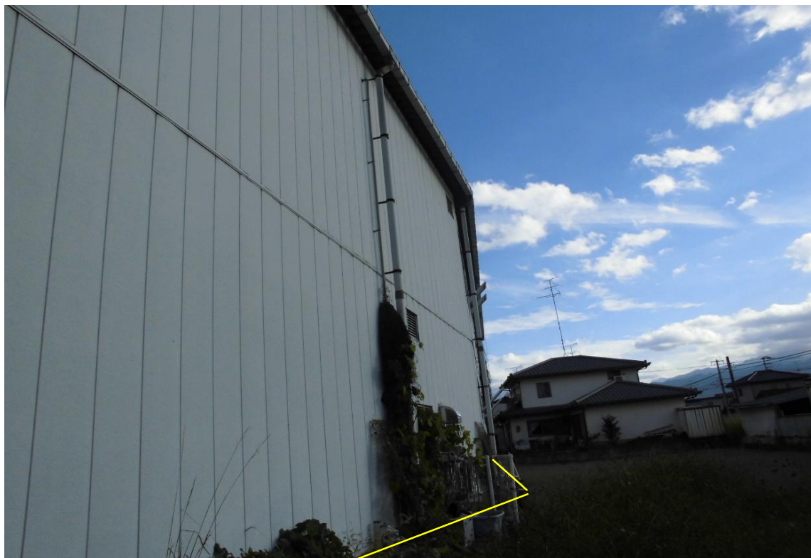
対象不動産の西側より撮影