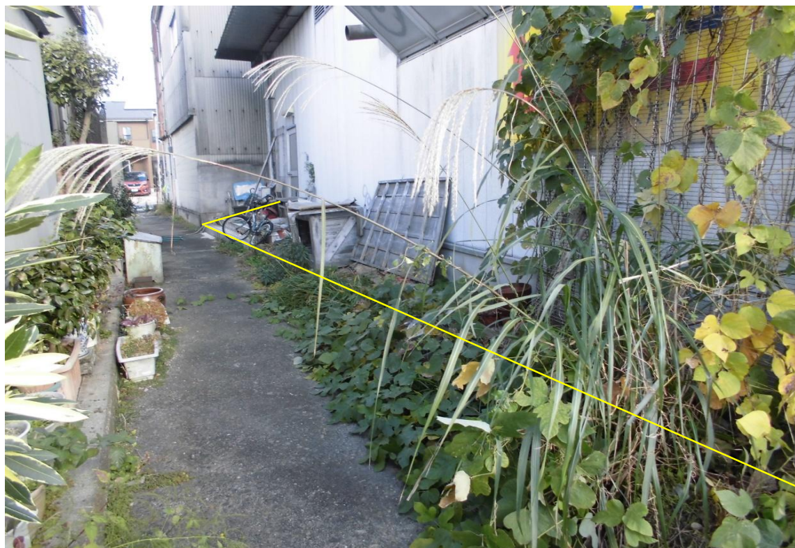
対象不動産の西側より撮影