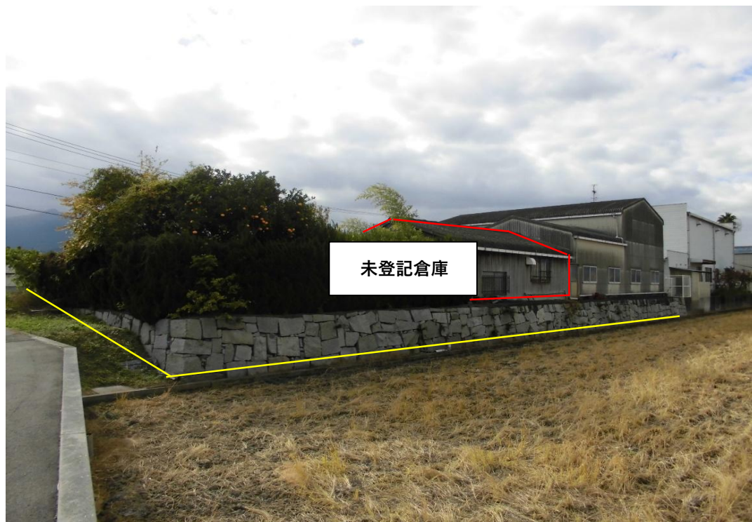
対象不動産の北側より撮影