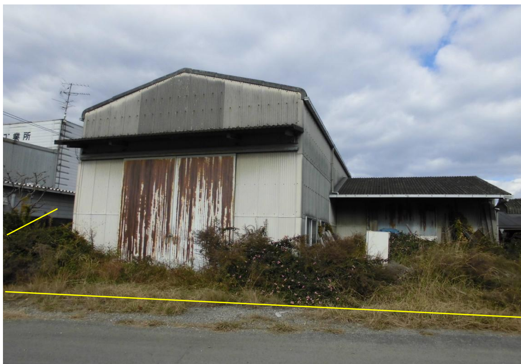
対象不動産の東南側より撮影