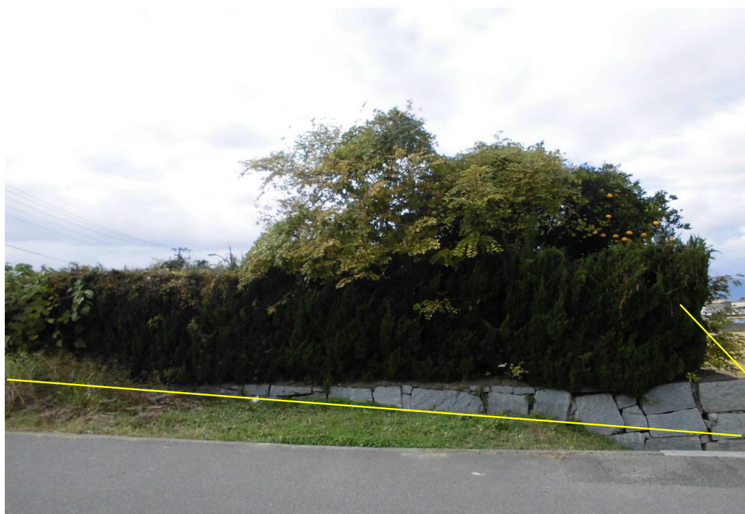
対象不動産の東側より撮影