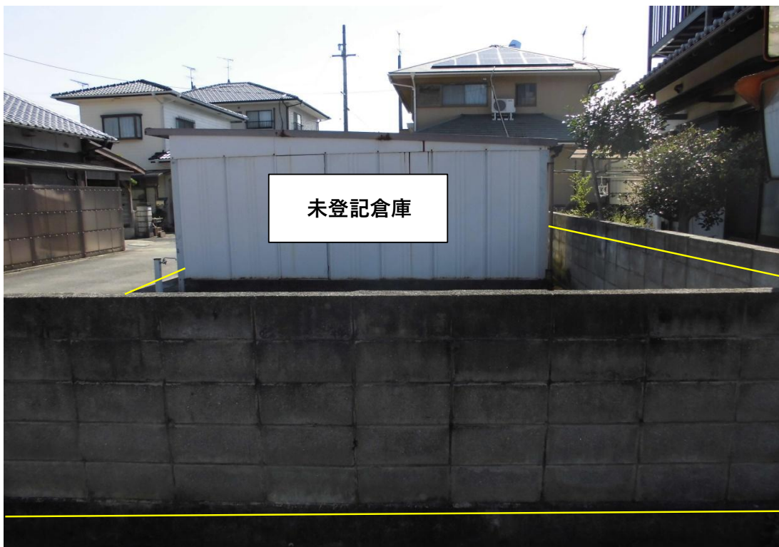
対象不動産の東側より撮影