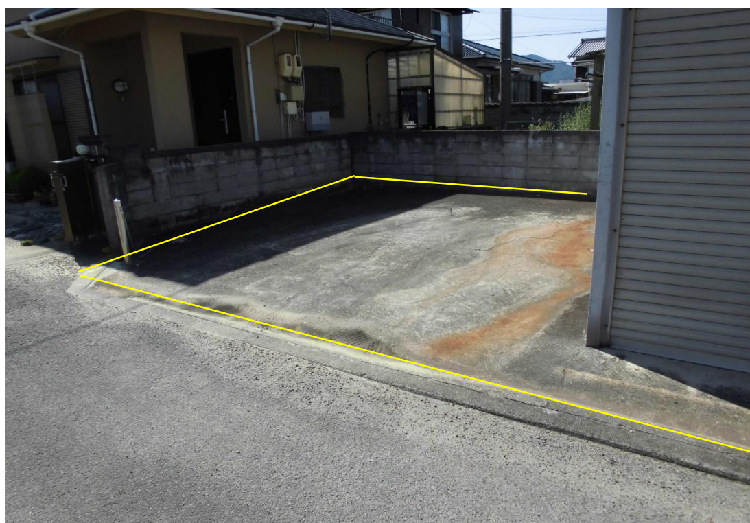
対象不動産の南側より撮影