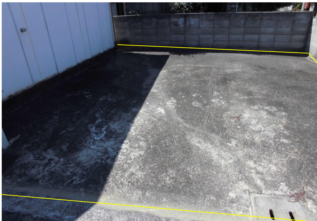
対象不動産の南側より撮影