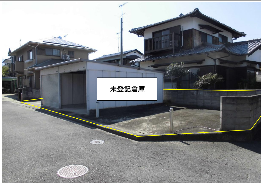
対象不動産の東南側より撮影