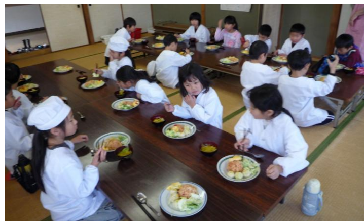
みんなそろって「いただきま～す♪」