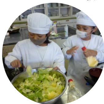
サラダにマヨネーズ投入