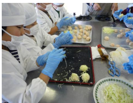
シュウマイの皮は千切りキャベツで