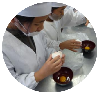
卵も上手に割れました