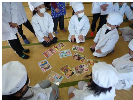
調理の前に「食育かるた」をしました