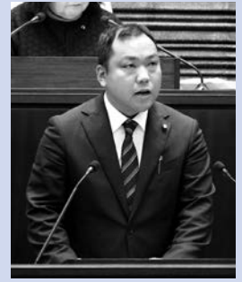
高木新治議員 夢みらいクラブ