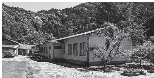
建物の老朽化などにより令和7年度末をもって閉館する市之川公民館

また、同公民館周辺は土砂災害警戒区域であるが、運営終了後は、市之川地区に常勤の市職員がいる施設がなくなるため、今後、台風などにより土砂災害が予想される場合は、早めの避難を呼びかけていきたい。