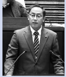
渡部 勤文 議員 会派に属さない議員