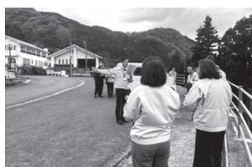
本谷温泉館の現地調査

また、常連客がこれまでどおり温泉を利用できるように配慮するとともに、令和7年9月に営業を終了していた食事処についても、メニューなど改善の上で再開する予定と聞き及んでいる。