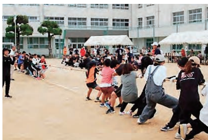
綱引き（地区別対抗）

3歳から小学校6年生までの学年別競争。特に幼児クラスの一所懸命さが微笑ましいです。