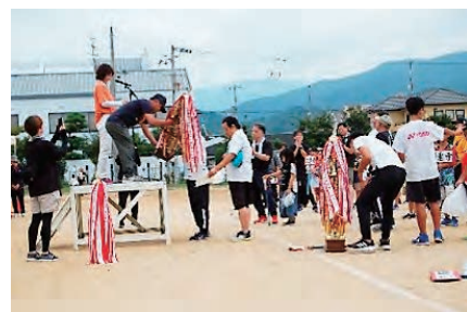
閉会式・トロフィー授与の様子

天候にも恵まれ平和な時間を楽しめました。来年度も平穏な大会開催に向けご協力願います。