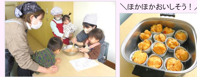
＼ほかほかおいしそう！／

かぼちゃやさつまいも、小松菜など野菜たっぷりの蒸しパンを4種作りました。野菜が苦手な子どもさんでも、これならパクパク食べられそう♪お家でもまた作ってみてくださいね。