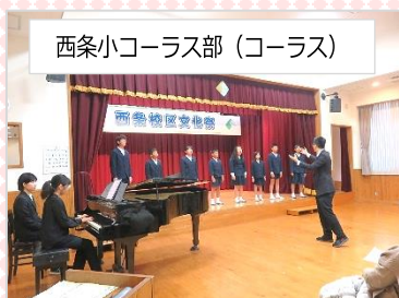
西条小コーラス部 (コーラス)