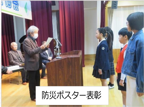
防災ポスター表彰