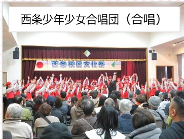
西条少年少女合唱団 (合唱)