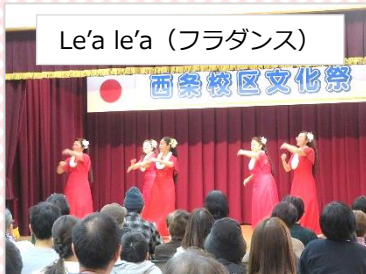
Le'a le'a (フラダンス)