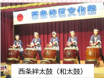
西条絆太鼓 (和太鼓)