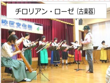
チロリアン・ローゼ (古楽器)