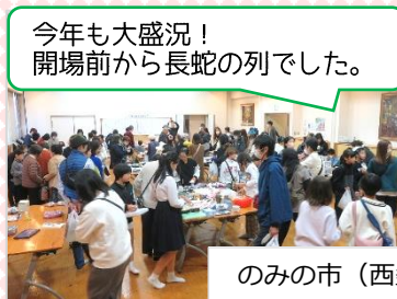
今年も大盛況！ 開場前から長蛇の列でした。