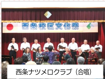
西条ナツメロクラブ (合唱)