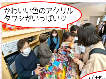
かわいい色のアクリル タワシがいっぱい♡