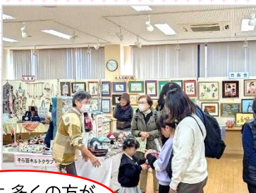
バザーも多くの方が 来てくれました♪