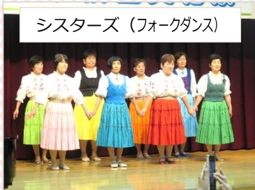
シスターズ (フォークダンス)