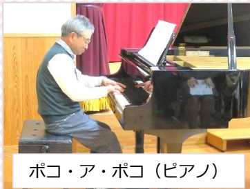
ポコ・ア・ポコ (ピアノ)