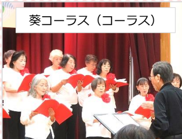
葵コーラス (コーラス)