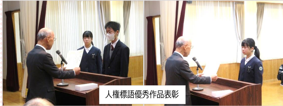
人権標語優秀作品表彰