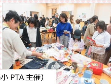
のみの市 (西条小 PTA 主催)