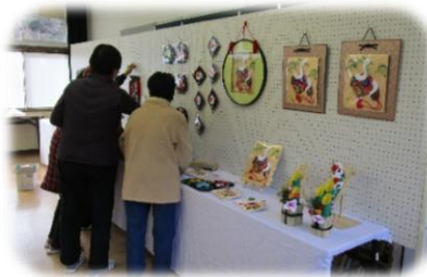
令和6年度の 作品展の様子