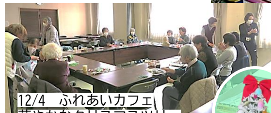
12/4 ふれあいカフェ 華やかなクリスマスツリー ができました。