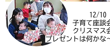
12/10 子育て座談会 クリスマス会 プレゼントは何か～