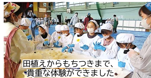
田植えからもちつきまで、 貴重な体験ができました。