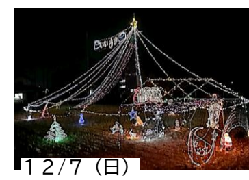
12/7(日) イルミネーションの設置

明けて おめでとうございます 本年もよろしく お願いいたします 〇とうど祭り関連の予定 ・組立: 1月4日(日) 9:00 ・当日: 1月11日(日) 7:00 準備 8:30 神事 ☆ご協力をお願いします 〇定例会: 1月13日(火) 19:30