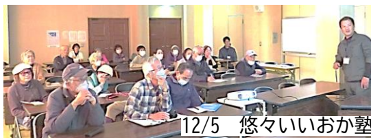
12/5 悠々いいおか塾 亀の甲発掘調査報告