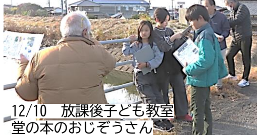
12/10 放課後子ども教室 堂の本のおじょうさん