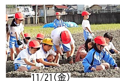
11/21(金) チューリップ球根植え