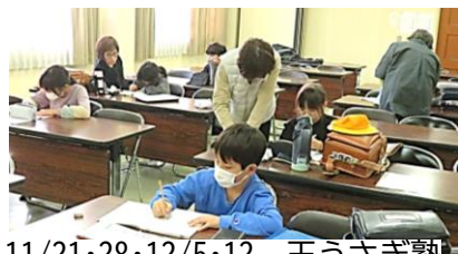
11/21・28・12/5・12 玉うさぎ塾