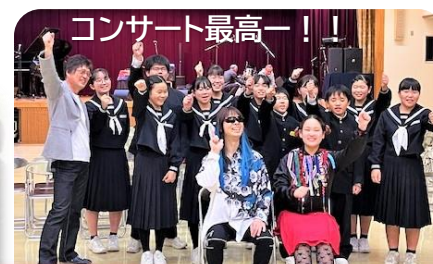
コンサート最高ー!!