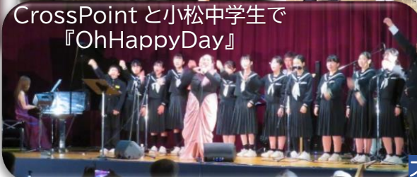
CrossPoint と小松中学生で 『OhHappyDay』