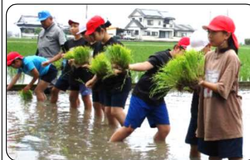
楽しそうな声が聞こえてきました

5/11(水)、吉井小学校の5年生が田植え体験を行いました。JA周桑の営農管理研修センターの方々に教わりながら、丁寧に植えていました。おいしいお米ができますように。