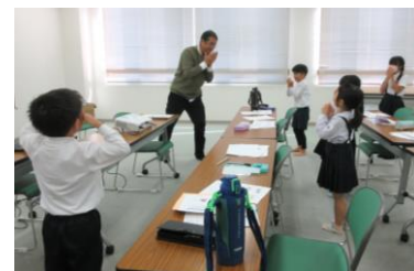
(音楽に合わせて体を動かす)