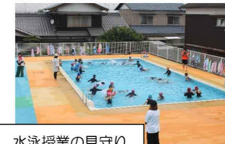
水泳授業の見守り