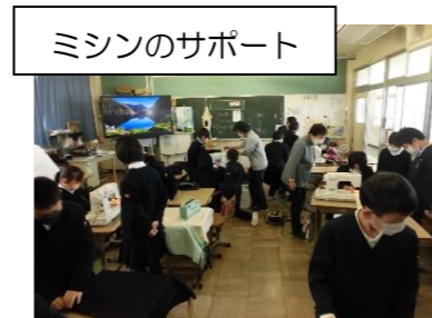
ミシンのサポート