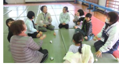
2/9 悠々いいおか塾 腰痛予防体操