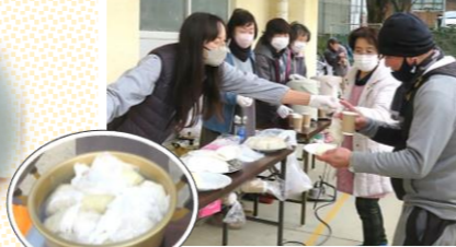
試行錯誤の炊き出し