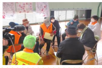
参加者みんなで話し合い