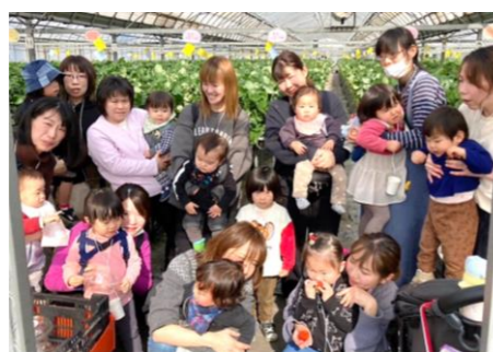
次回3/6は『読み聞かせ』です。