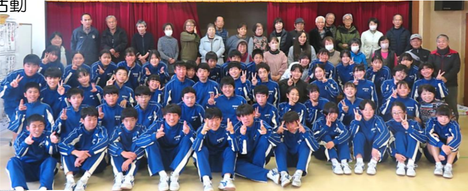
隅々までピカピカになりました。ありがとうございました。

2月2日(金)西条東中2年生の皆さんが少年の日の記念行事として公民館を訪れました。地域協力者と共に年齢の垣根を越えて協力し合い、館内外の清掃を行いました。また、地域防災についても学び、これから地域の一員として、大きく成長してくれることでしょう。