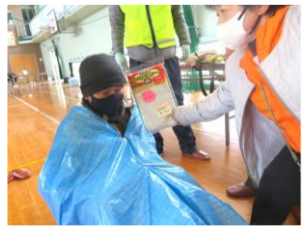
実演!ブルーシート寝袋

まず、一部の地区(5地区)で安否確認タスキにより住民の安否(無事)を確認し、地区対策本部(公民館)で報告を受ける訓練を実践しました。次に、小学校東体育館に地区全体から避難訓練者が参加。市の危機管理課から能登地震など実際の災害を想定した地域防災計画についてのお話や、地域の防災士により地域や家庭で取り組む防災活動についてワークショップが行われました。また、災害時を想定して参加者が持ち寄ったお米をポリ袋で炊飯し、参加者全員で試食しました。いざというとき、地域がどう動くか、一人一人がどう行動すべきか、被害者「0」を目指し地域を守るという共通認識をさらに高められたと思います。なお、今回の訓練では、ハートネット(CATV)の取材もあり2月14日に放送されました。