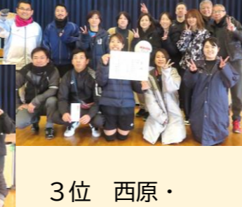
3位 西原・西大道 六地蔵

「地域の問題を解決するには」～連合自治会定例会～自治会長研修会を開催 1月30日(火)