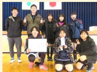
1位 グリーンハイツB