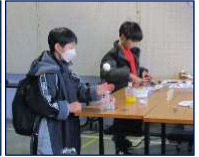
子ども科学あそび