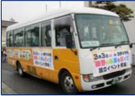
周桑バスで地域を巡回し、多くの皆さまにご乗車いただきました。