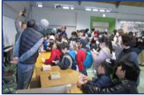
大人気！ビンゴゲーム