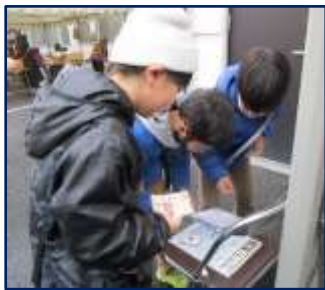
防災スタンプラリー