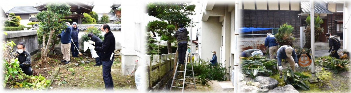
▲公民館周辺剪定実施で風通しが良くなりました▲

館周辺の木々はバツサリと散髪されスッキリと見通しも良くなり、館内も隅々まで掃除して頂き、気持ちのよい公民館に変身しました。ありがとうございました。<(_ _)>