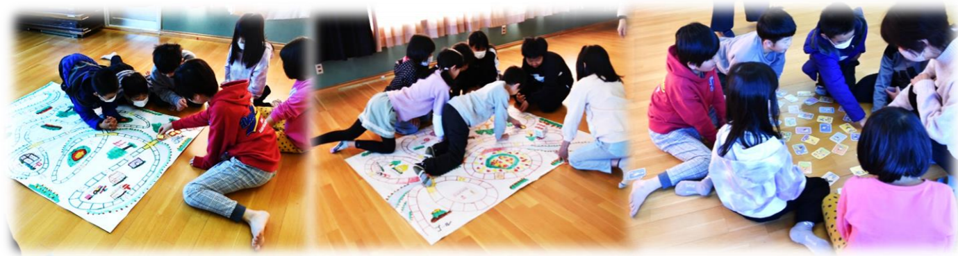
▲ 身を乗り出して皆で楽しむ姿がいいですね！

最近ではゲーム機器で一人遊びする事が増えている中、日頃お目にかからない遊びに、大人数でワイワイ・キャーキャーと遊ぶのは楽しい時間の様でした。これからも沢山の子供達に参加して頂き、楽しい時間を共有しながら、新しい仲間作りをして頂けたらと思います。