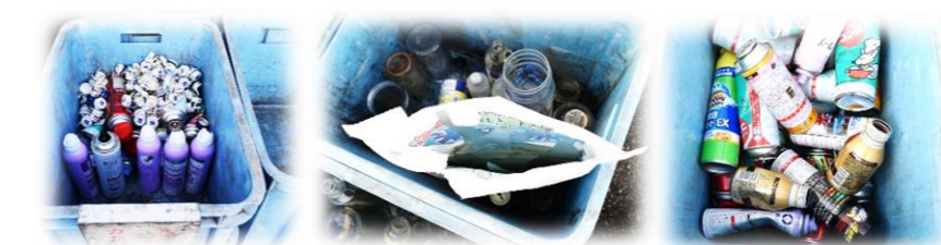
▲ 汚れたままのペットボトルとカセットボンベをそのまま放置。

また、毎月第一水曜日の資源ごみ回収（びん・ペットボトル・スプレー・カセット用ガス缶）日に、栄養ドリンクのふたや割れたガラス、乾電池、陶器、蛍光灯、缶詰缶、飲料缶が置かれています。指定以外の物は入れない様お願いします。ガス缶は必ず穴あけして残ガスを抜いて下さい。運用ルールを守って皆が気持ちよい多賀地区を目指し、子供の見本となりましょう。