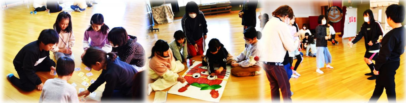
▲ 遊びとは言え、カルタは記憶力・瞬発力・集中力が身につきます。