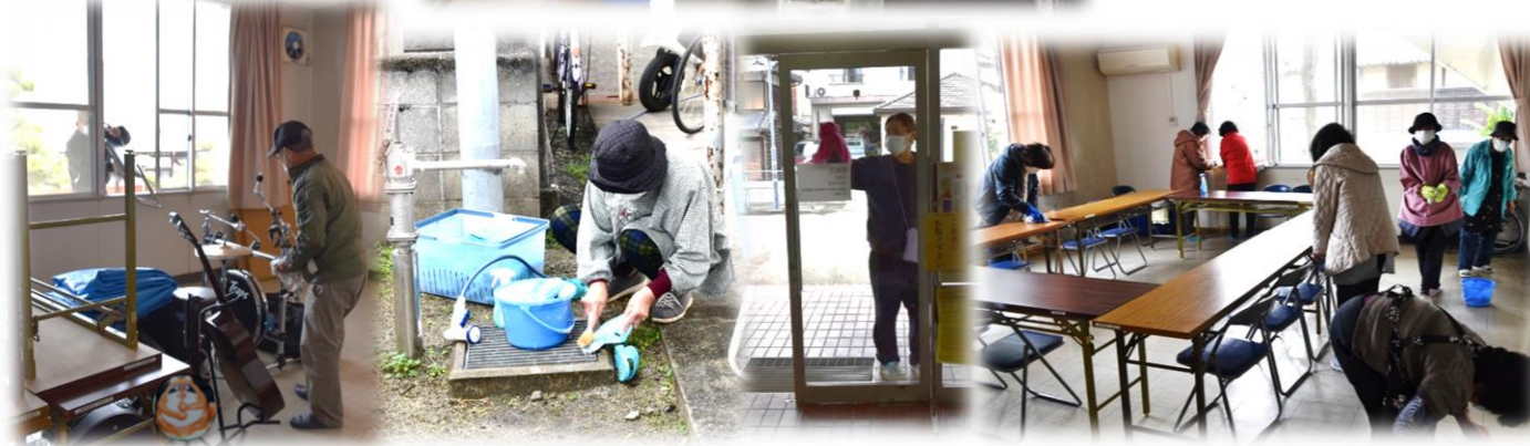
▲館内、窓、非常階段、備品などの掃除で、きれいになり、安全面や衛生面も良くなりました。✧