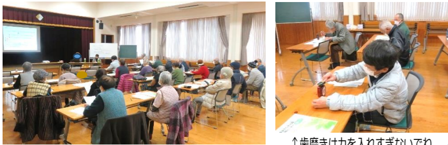
↑歯磨きは力を入れすぎないでね。