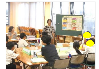
【本と遊ぼう】(in 公民館) 協力：ほんわかルーム