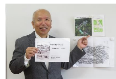
【西条市の歴史】(in 小学校) 協力：浅田延也氏

「地域とともにある学校づくり」の一環として、公民館サークルや地域の皆様の協力をいただき、西条小学校の3つのクラブ活動が行われました。