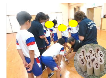
【軽スポーツ】(in 公民館) 協力：スポーツ推進員