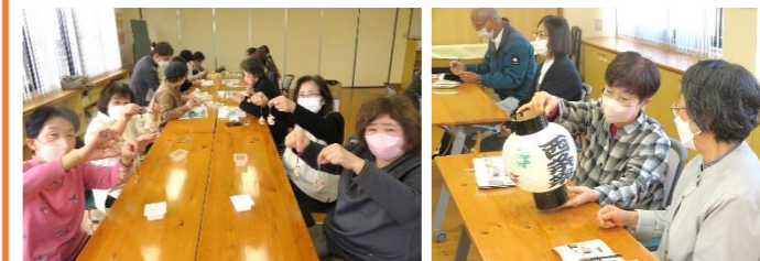
革細工教室や伝統工芸の手仕事など、新しい学びがたくさんありました。来年度も楽しみに待っていてくださいね。