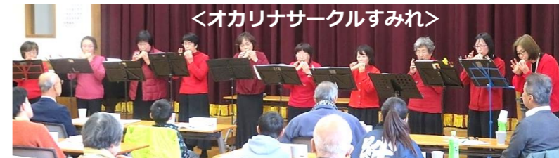
<オカリナサークルすみれ>