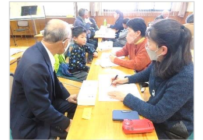
大人も子どもと一緒に今日の講座を振り返りました。