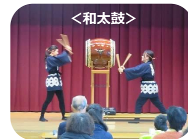
↑オープニング演奏 ↓カフェタイムのオカリナ演奏

アンコンシャス・バイアスとは、誰しもが意識せずとも持ってしまうような偏った先入観や偏見のこと。「普通」はそうだとか「どうせムリ」のような価値観や能力の決めつけ言葉、「そんなはずはない」とか「こうあるべきだ」のような解釈や理想の押し付け言葉を使って無意識のうちに人を傷つけてないか振り返る時間になりました。