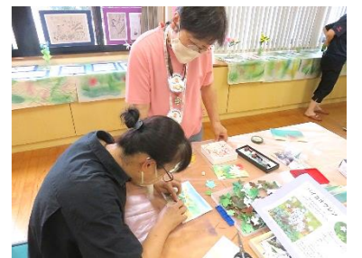
毎月第3日曜の「本ようび」のほか、連休を利用しての「あそぼう会」などを開催。牧野富太郎をテーマした回もありました。