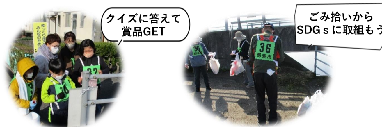
主催 / 禎瑞地区スポーツ協会・禎瑞連合自治会・禎瑞公民館

雨天時は小学校体育館でレクリエーションを行ないます。 全員に参加賞があります！ご家族、ご友人お誘い合わせの上、 ふるってご参加ください。