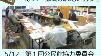
5/12 第1回公民館協力委員会