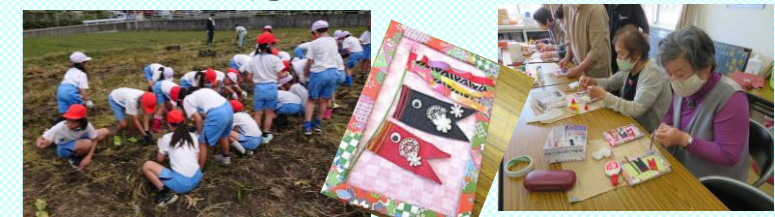
5/11 飯岡ふれあいカフェ