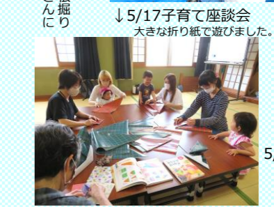
5/17子育て座談会 大きな折り紙で遊びました。