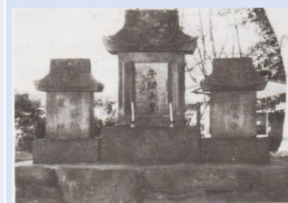
中村の祭神の牛頭天王