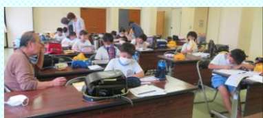
5/11・18 玉うさぎ塾がスタートしました。