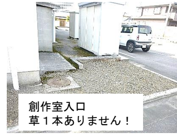
創作室入口 草1本ありません！

公民館で活動されている「寄ろず会」さんの除草作業。毎年ボランティアで公民館周囲をきれいにしてくださる、ありがとうございます。