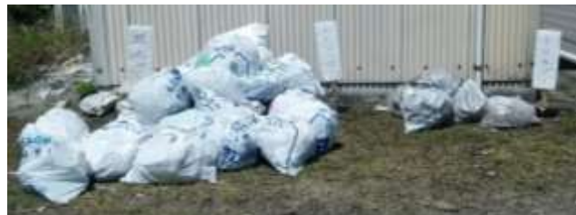
公民館・光下田消防詰所横へ集められたゴミ