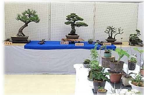
会場で作品を堪能・・・