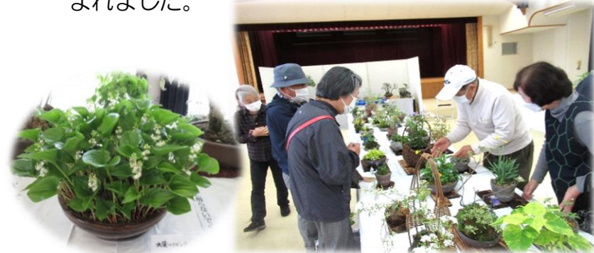
春の陽気に誘われて・・・

訪れた人々から「山野草の名前は・・・」「育て方は・・・」などの質問に、会員の皆さんは丁寧に説明されていました。