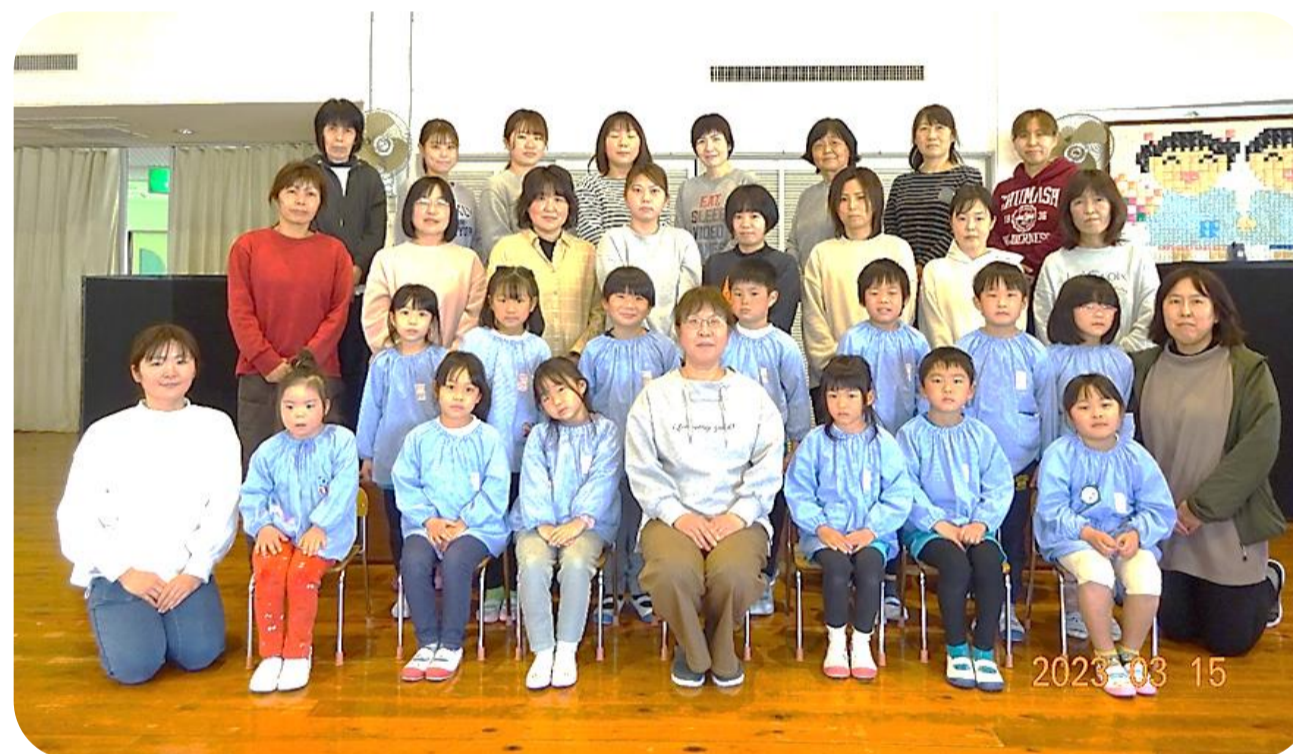
令和4年度禎瑞保育所卒園児 13人