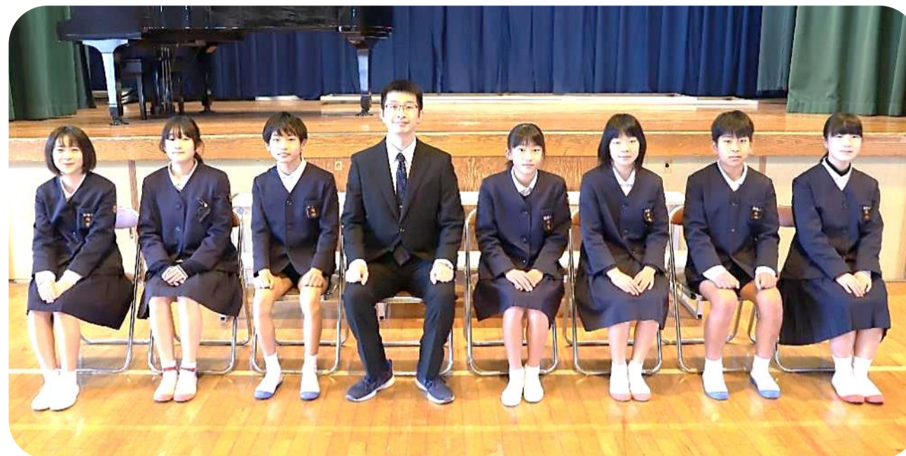
令和4年度禎瑞小学校卒業生 7人

学び舎を巣立つ皆さんが、これからも素晴らしい日々を過ごされますようお祈りし、お祝い申し上げます。