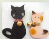
ネコブローチ 2個セット 400円