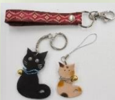
各キーホルダー 200円~400円