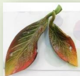
葉っぱブローチ 大小セット:500円