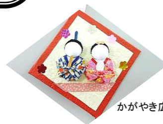
かがやき広場作品