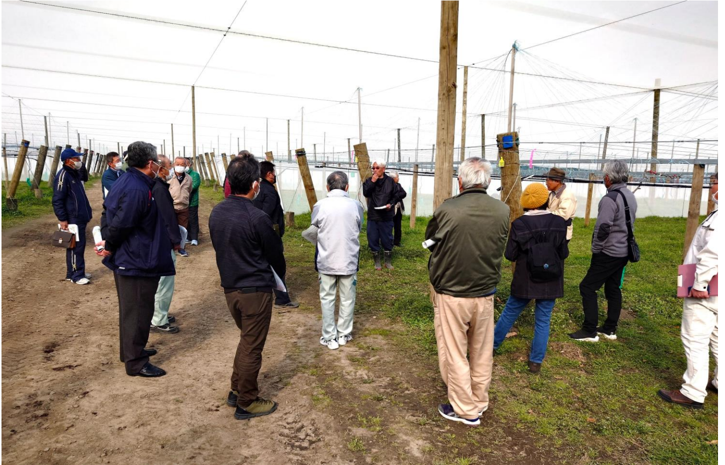
視察研修の様子（株式会社イーキウイの農園にて）