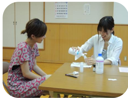
6/11 アロマな虫よけスプレー作り