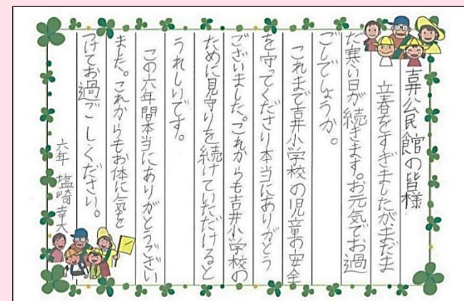
吉井小6年生が、見守りのお礼の手紙を届けてくれました。卒業しても、みなさんはずっと大切な吉井の子です。

なお、令和6年度第1回の協力委員会を4月16日(火)19:30から開催する予定です。委員の方には文書でお知らせいたします。