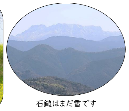
石鏡はまだ雪です