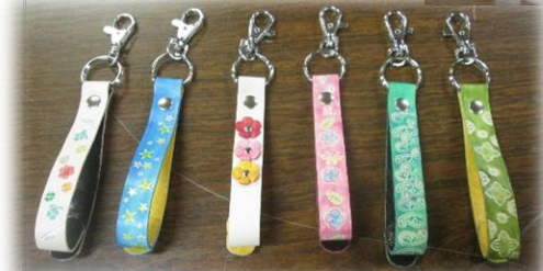
私だけの「イッピン」ができました。