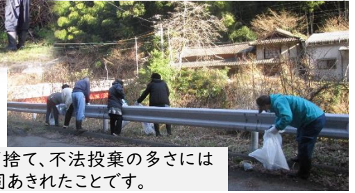
ポイ捨て、不法投棄の多さには 一同あきれたことです。