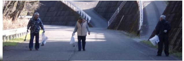
環境美化運動の一環として、 みんなで仲良くごみ拾い。 時々、樹木の手入れ。

公民館前に集合、県道・市道沿いのごみ拾いを中心 に行いました。ご協力ありがとうございました。