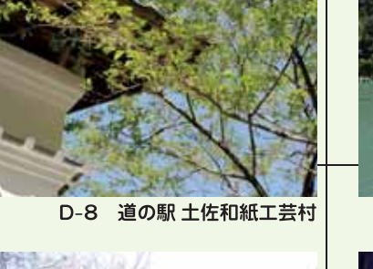
D-8 道の駅 土佐和紙工芸村