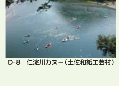
D-8 仁淀川カヌー(土佐和紙工芸村)