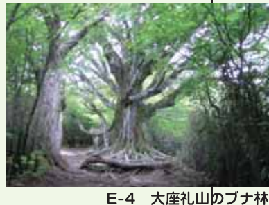
E-4 大座礼山のブナ林