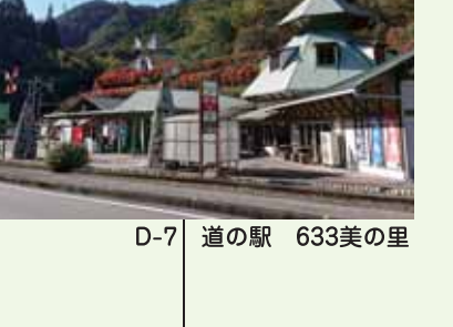
D-7 道の駅 633美の里