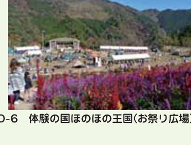
D-6 体験の国ほのほ王国(お祭り広場)