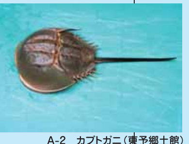
A-2 カブトガニ(東予郷土館)