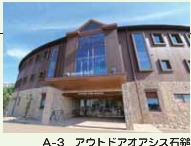
A-3 アウトドアオアシス石鎚