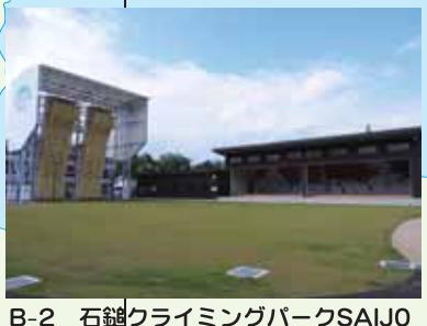
B-2 石鎚クライミングパークSAIJO