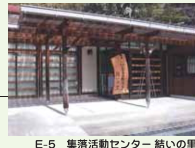
E-5 集落活動センター 結いの里