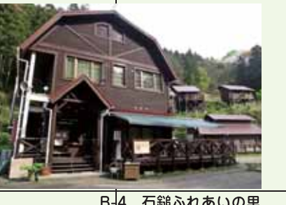
B-4 石鎚ふれあいの里