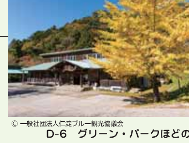
D-6 グリーン・パークほどの