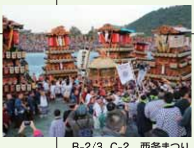
B-2/3 C-2 西条まつり