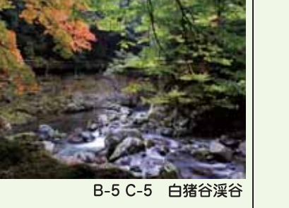
B-5 C-5 白猪谷渓谷