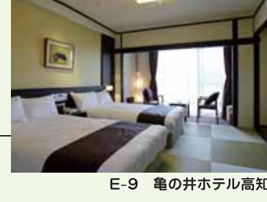
E-9 電の井ホテル高知