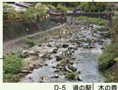
D-5 道の駅 木の香