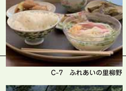
C-7 ふれあいの里柳野